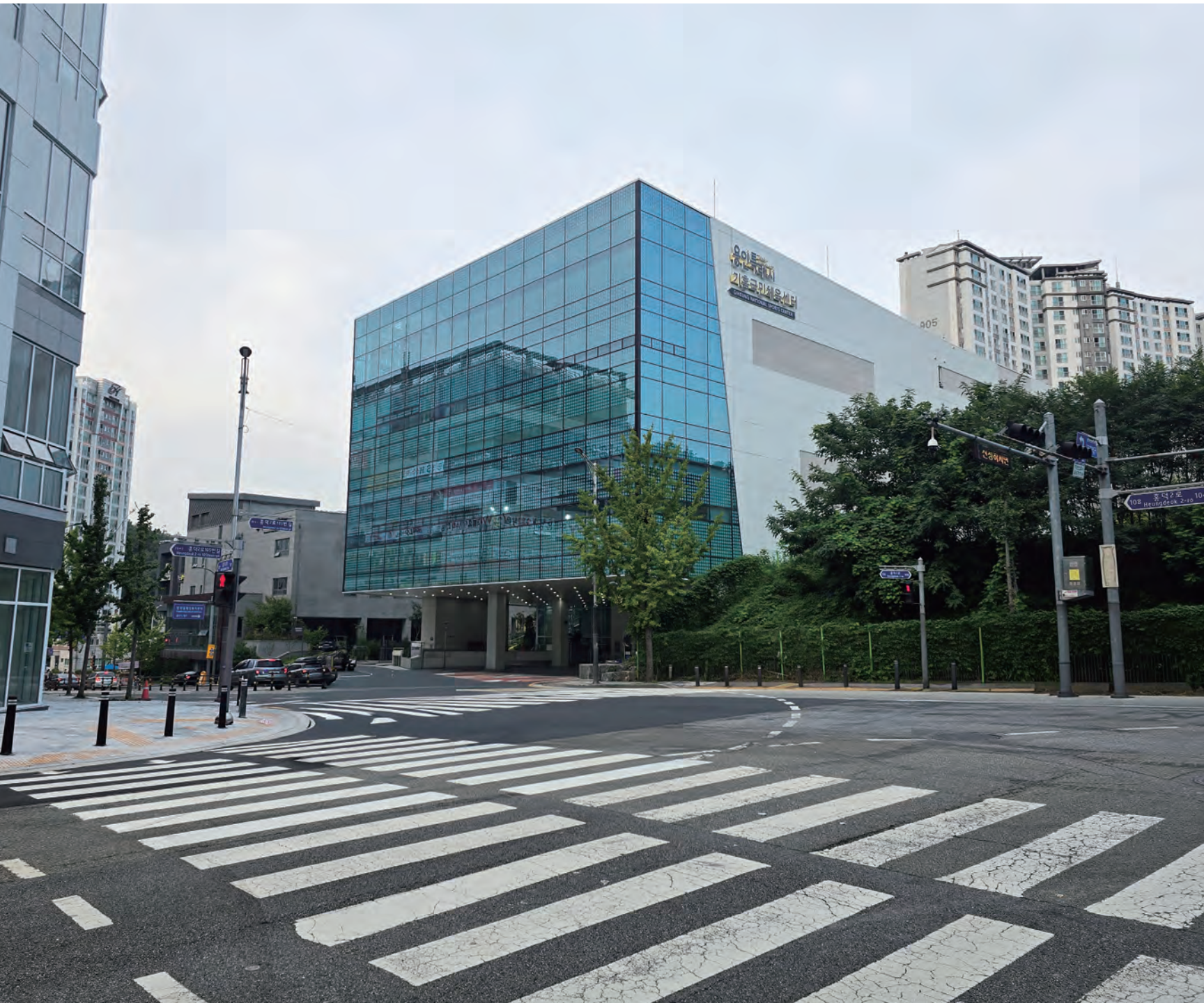
흥덕청소년문화의집 및 기흥국민체육센터 건립사업