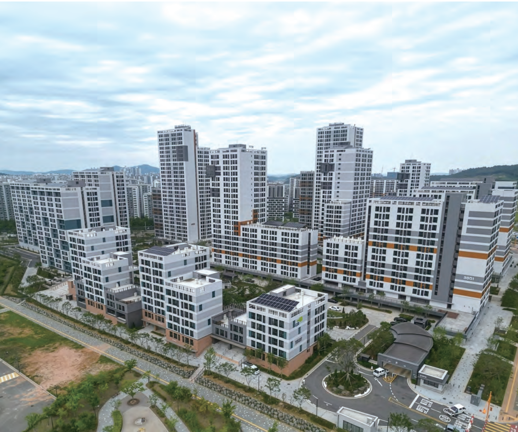
인천검단 AA35-1BL 및 AA35-2BL 아파트 건설공사 8공구