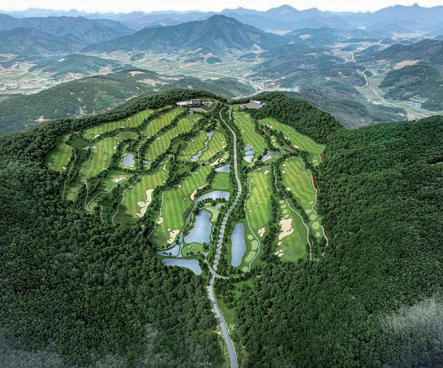
로제비양 G.C 순창