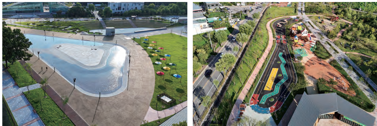
천안삼거리공원 재개발사업 2단계